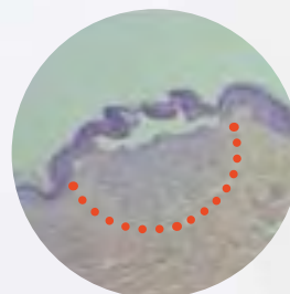
C1 Tips (Roller, Square, Comb)