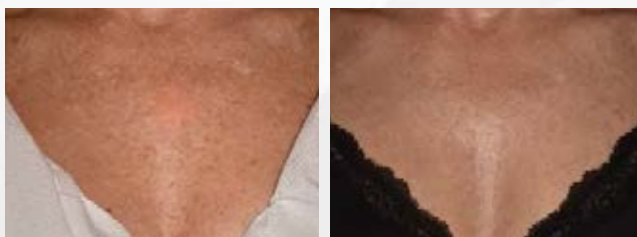
Antes y después de 2 tratamientos