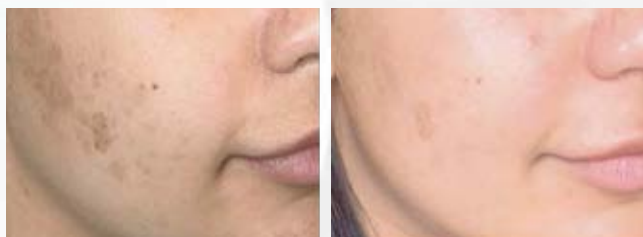
Antes y después de 2 tratamientos