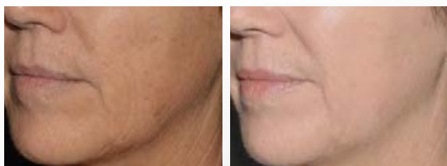
Antes y después de 3 tratamientos